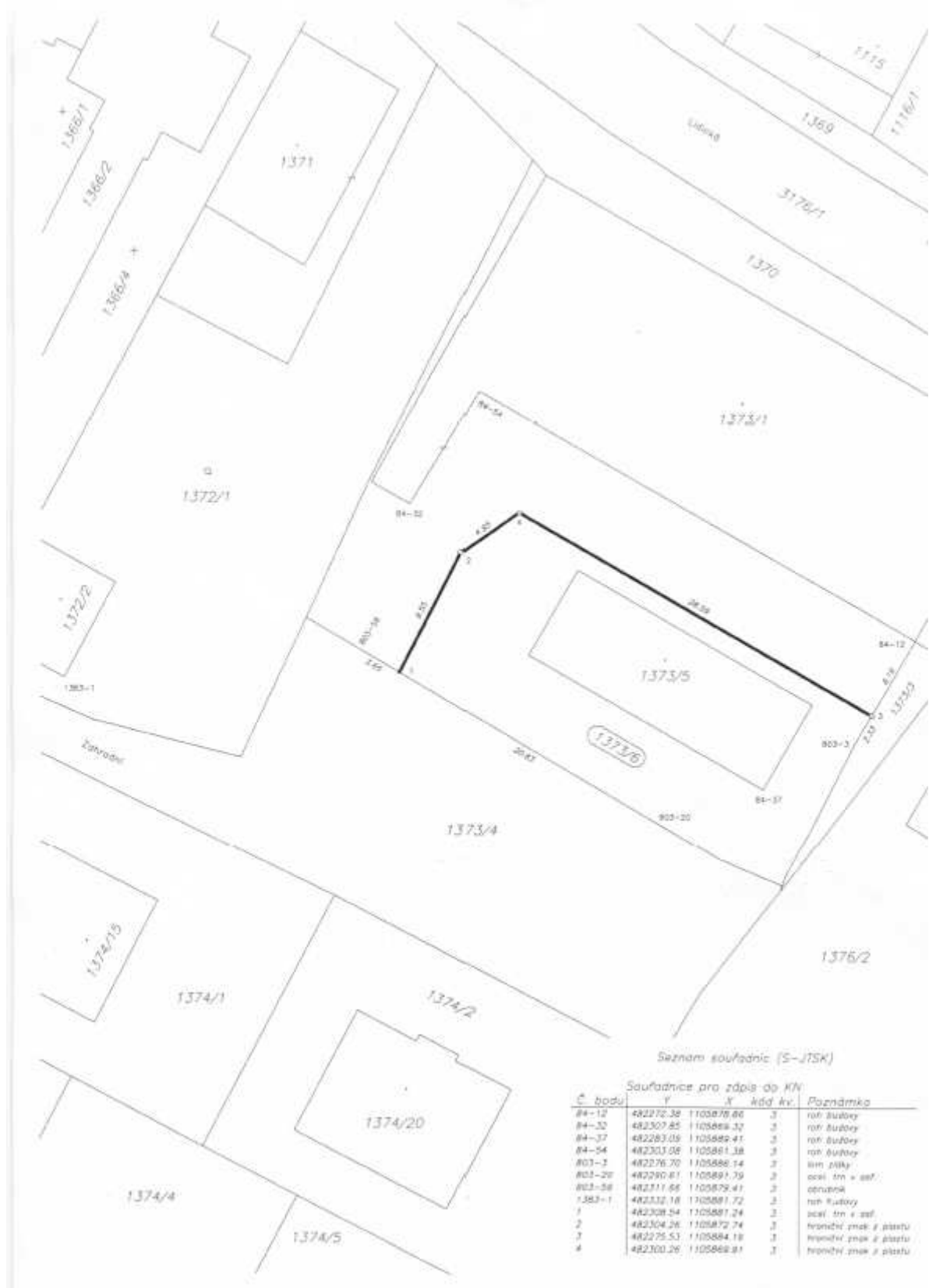
Seznam souřadnic (S-JTSK)