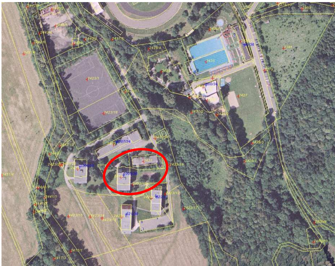
Fotodokumentace v k. ú. a obec Kopřivnice