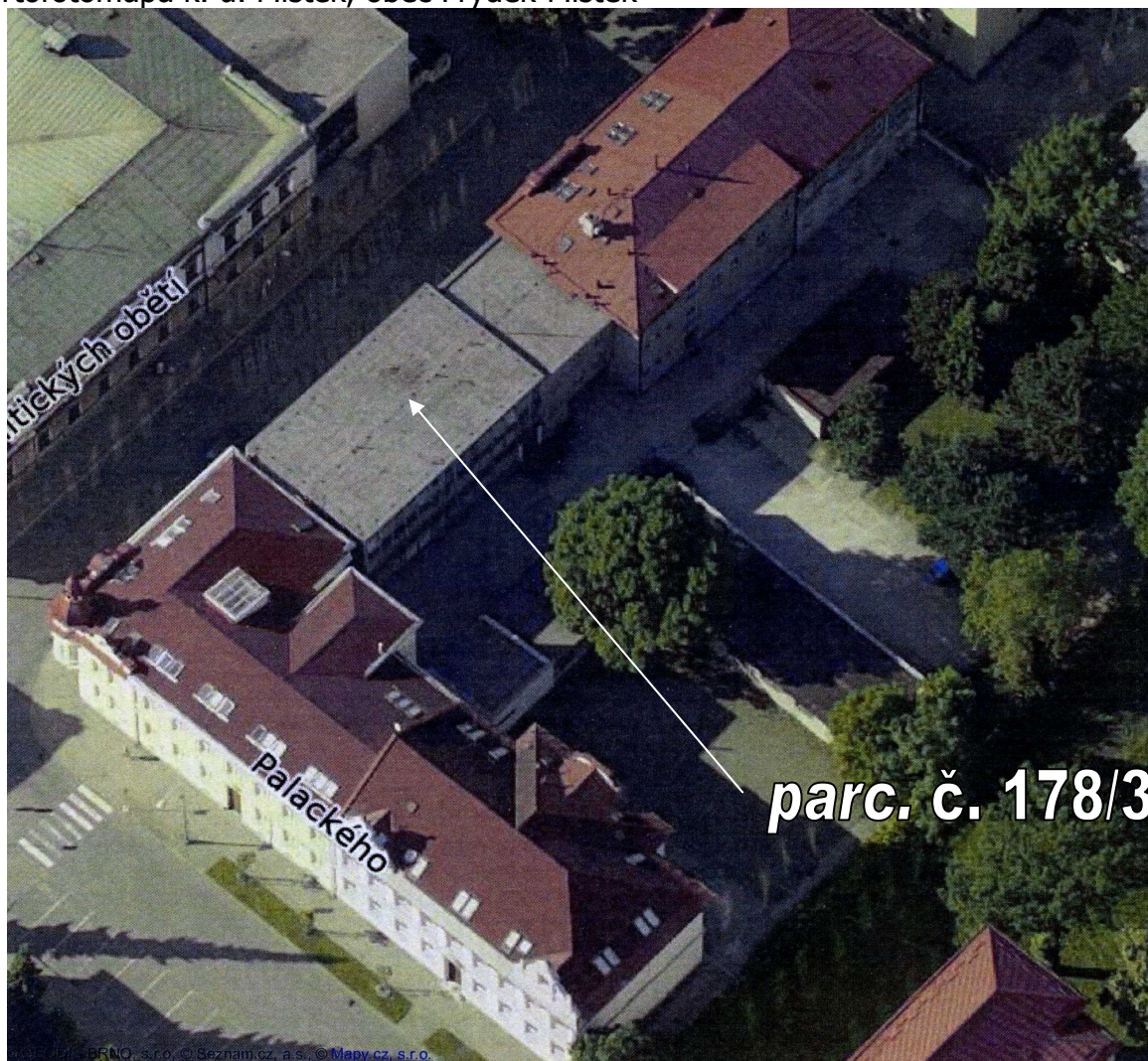
Fotodokumentace k. ú. Místek, obec Frýdek-Místek