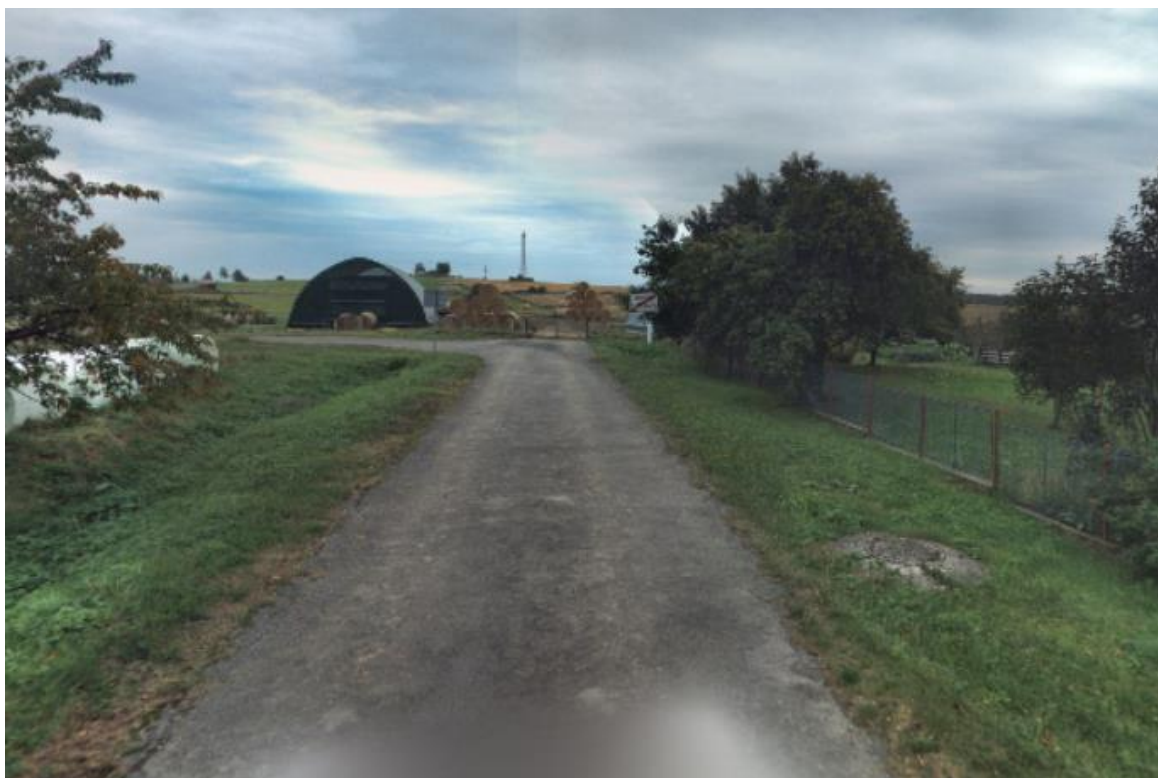
pozemek parc. č. 2663/20 (dále za plot)