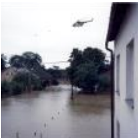
Povodeň v Kopytově – shazování humanitární pomoci vrtulníku