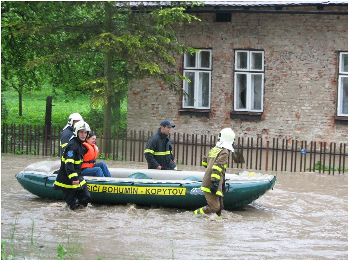
Evakuace osob – Kopytov povodeň 2010