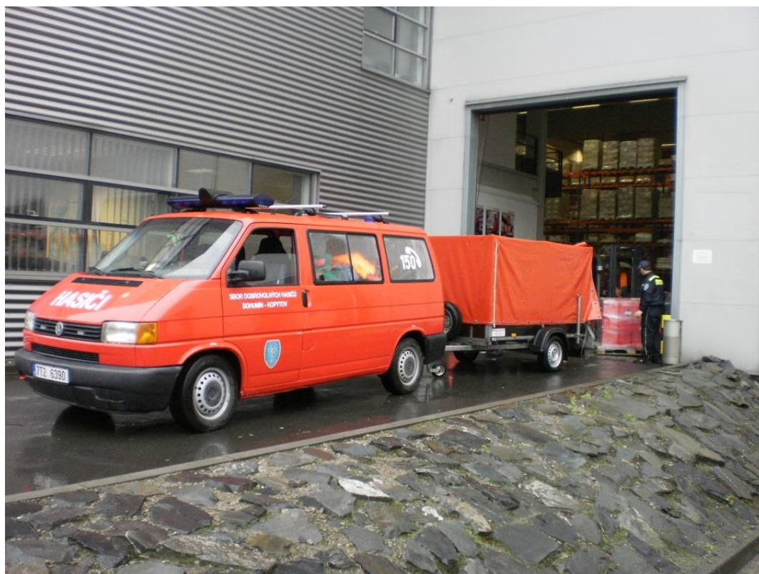
Rozvoz humanitární pomoci dopravním vozidlem