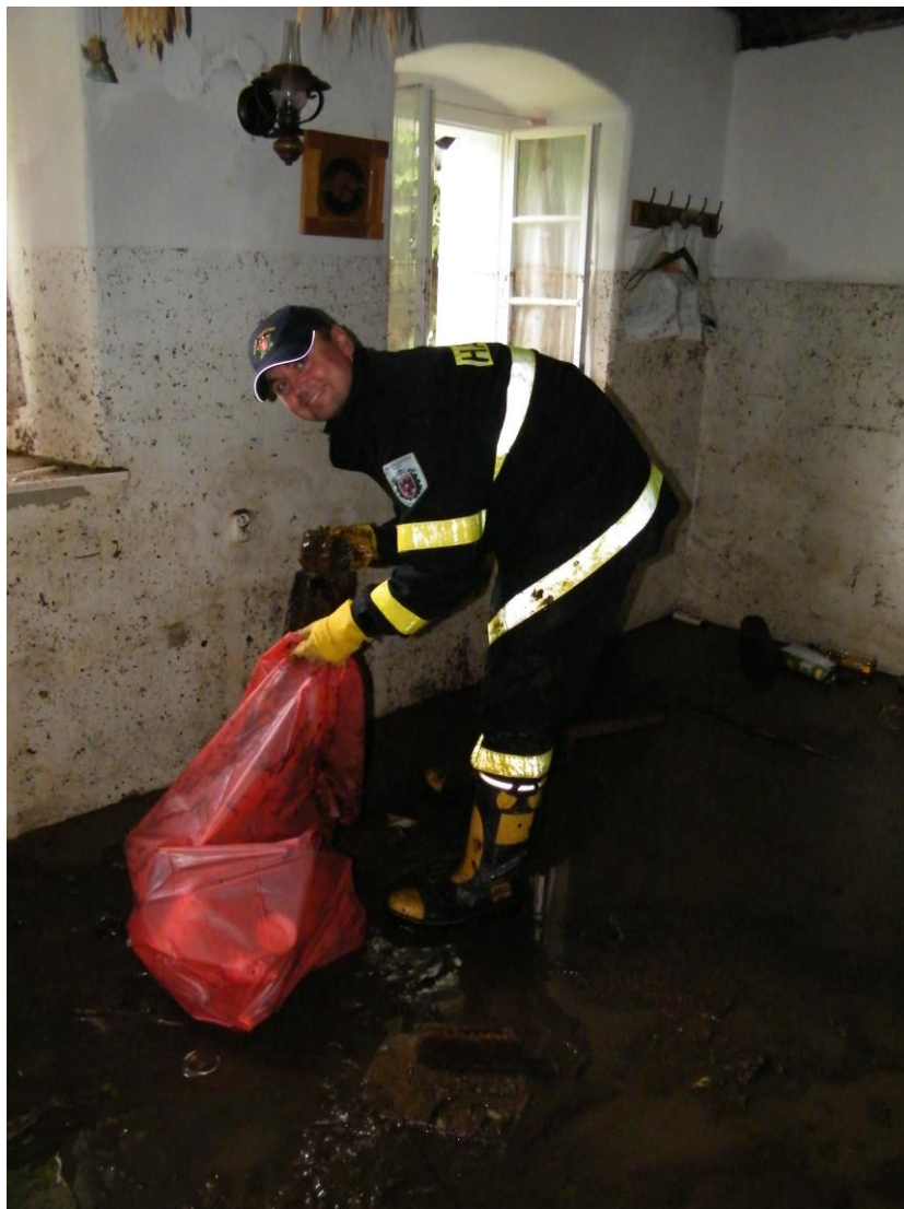
Úklid po povodních – odklizení bahna