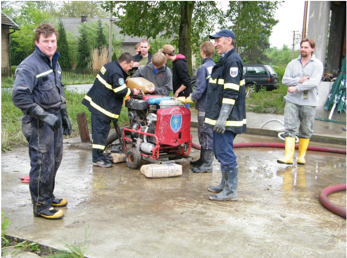
Likvidační práce Kopytov – čerpání zatopených sklepů