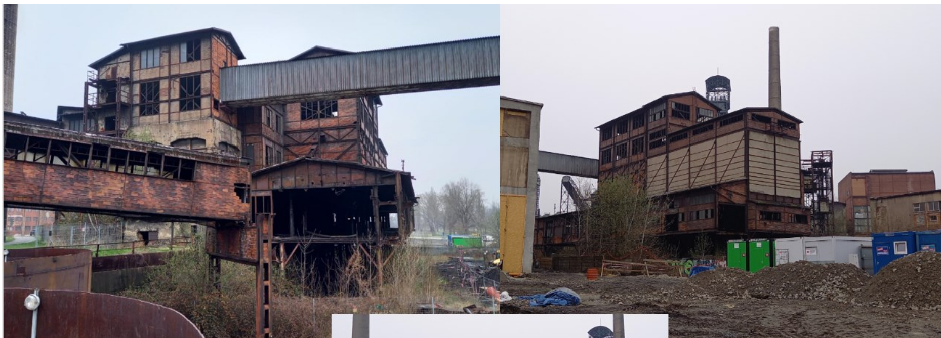
Třídírna uhlí Karlštejn Mašinka