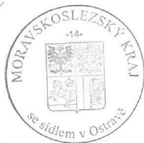
Příloha č. 1 – nákladový rozpočet