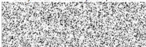
místostarostka města Bruntálu

Děkujeme za vstřícnost a jsme s pozdravem