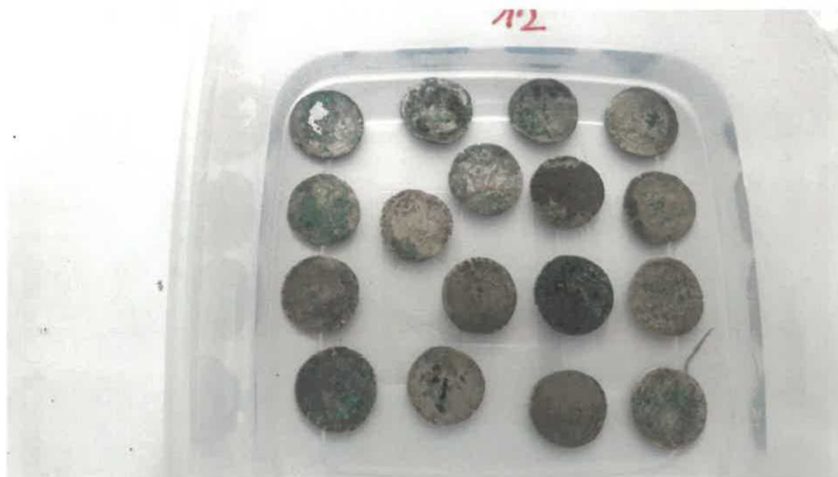
Čištění pražských grošů z nálezu Klokočov u Vítkova

Nález se skládal z mimořádně velkého souboru mincí, jejichž množství bylo přibližně určeno na 2221 ks, 2 uložených v dobové keramické nádobě poškozené při provádění strojní skrývky. Jedná se o běžnou kuchyňskou keramiku pozdně středověké produkce, vejčitého až soudkovitého tvaru s viditelnou šroubovicí a rovným dnem. Nádoba šedavé až světle šedohnědé barvy má okraj zakončený klasickým středověkým okružím, které lze využít pro dataci výrobku do pokročilého 14. až do 15. století. S tímto zjištěním časově koresponduje mincovní složka nálezu obsahující pražské groše Karla IV. a Václava IV. Ještě před provedeným čištěním naznačovaly některé kusy slepené navzájem měděnkou, že byly mince původně naskládány na sobě ve sloupcích. U třech vybraných mincí byly provedeny analýzy jejich povrchu a chemického složení technikou řádkovací elektronové mikroskopie, rentgenové fluorescenční spektroskopie a rentgenové práškové difrakce. Kromě mincí a keramické nádoby objevil nálezce ve vybagrované zemině ještě několik zlomků keramiky a fragment kachle, které však se středověkým nálezem nesouvisí, protože jsou datovány do 18. až 19. století.