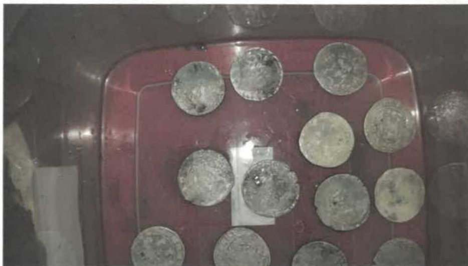
Pražské groše z nálezů v Klokočově u Vítkova