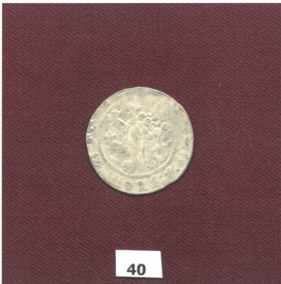
Pražský groš Václava IV. z nálezů v Klokočově u Vítkova