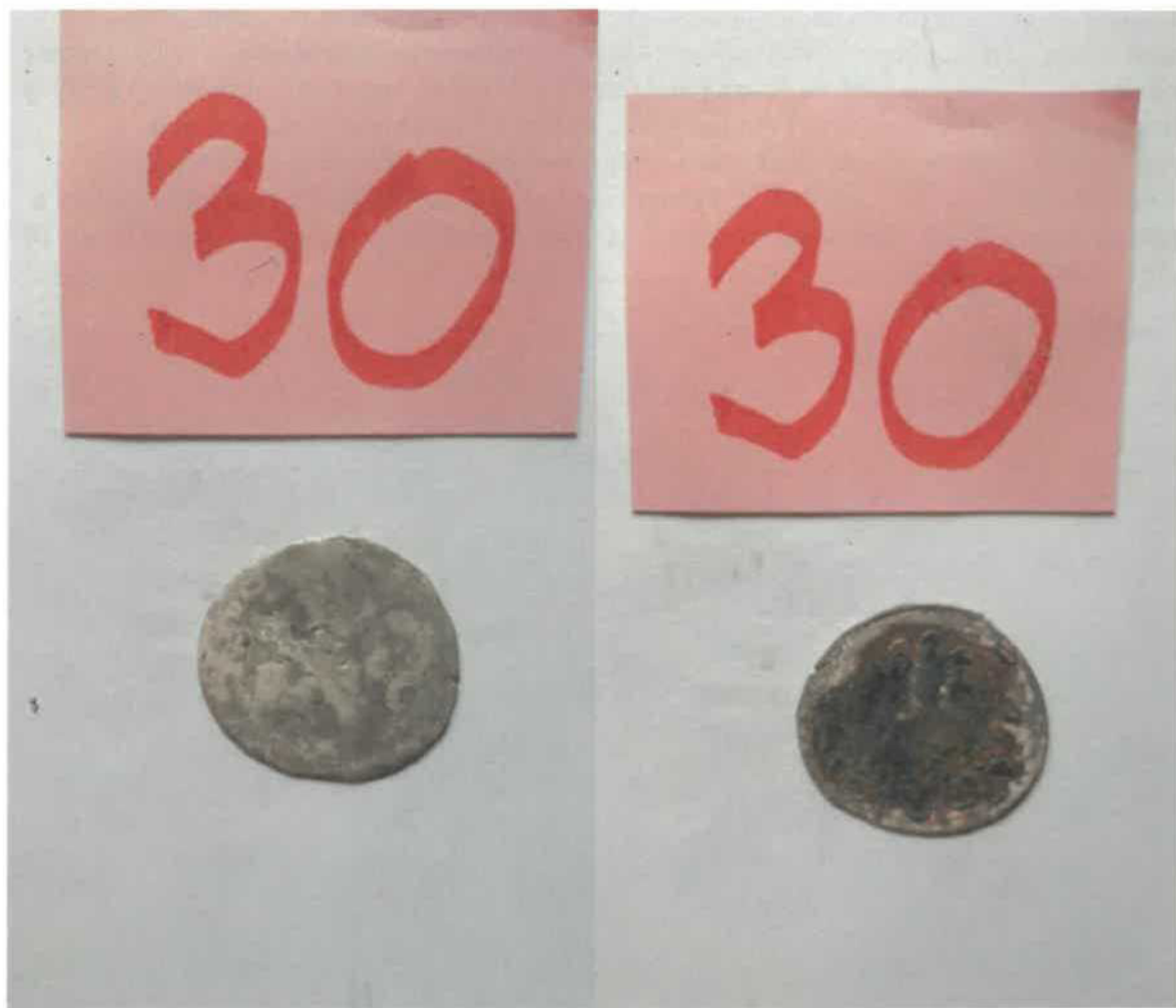
Pražský groš Václava IV. z nálezu v Klokočově u Vítkova

mincovna: Kutná Hora , pražský groš, nečištěný (2 ks)