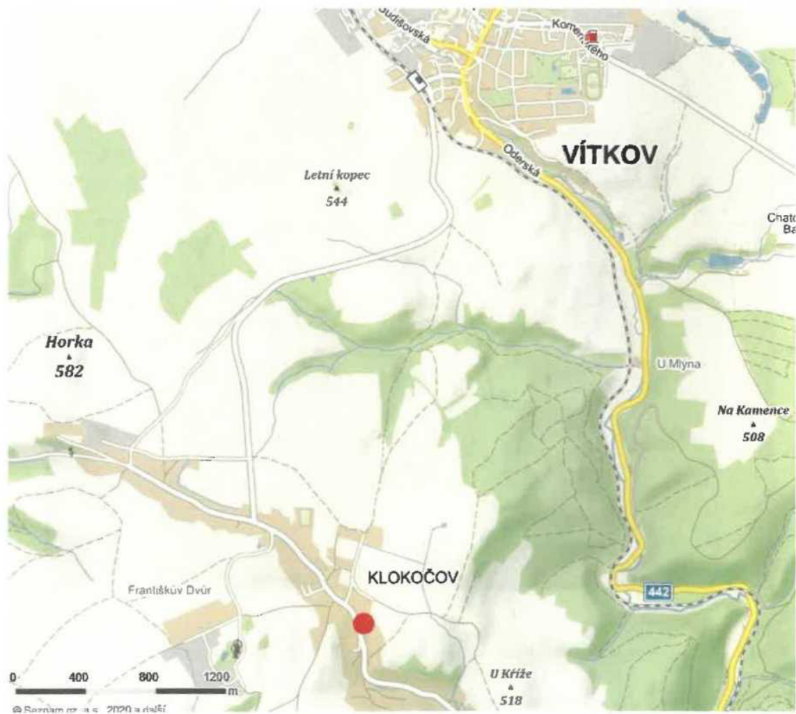
Mapa s vyznačením místa nálezů v Klokočově u Vítkova

Předmětem tohoto posudku je stanovení kulturně-historické hodnoty depotu středověkých mincí, objeveného počátkem června 2016 na k. ú. Klokočov u Vítkova (okres Opava). Nález byl původně uložen ve Slezském zemském muzeu v Opavě a později na základě rozhodnutí Rady kraje převeden do sbírky Muzea Beskyd Frýdek-Místek, které zadalo jeho odborné čištění a konzervaci P. Storzerovi. Pro vyhotovení posudku byla vzata v úvahu cena těchto mincí na sběratelském trhu, jejich zachovalost i význam depotu jako důležitého pramene dokumentujícího peněžní vývoj našich zemí v první třetině 15. století. Na základě kulturně-historické ceny byla určena zákonná výše odměny nálezci, která podle současných právních předpisů činí 10% z celkové hodnoty nálezů.